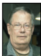
Brf. Främby Gård Föreningsnytt från styrelsen Lars Jansson Red./layout/foto

I nästa nummer av Föreningsnytt vill jag bara skriva om glada och trevliga nyheter.