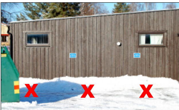
Här finns en möjlighet att få tre, i varje fall minst två, p-platser med motorvärmare. Vad som kan ställa till problem är om de planerade Molokerna tar mer plats. De skall ju stå så att kranbilen kan nå dem.