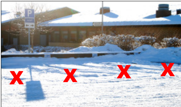
Här går det att få 4 p-platser utan motorvärmare

Vidare planeras att ta bort våra kompostanläggningar och ersätta dem med Molokpåsar, på samma sätt som vi planerar att använda Molok till vanliga sopor. Detta skulle ge ett garage med högt i tak. Det är det gamla traktorgaraget där en av kompostmaskinerna står.